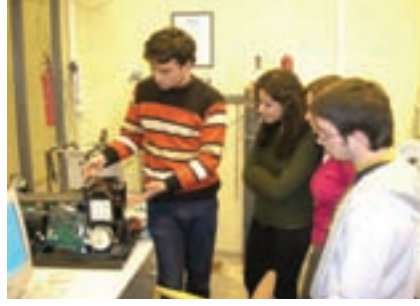
Mekanik ekibindeki arkadaşlarımız genç arkadaşlarımıza yakıt pili hakkında bilgi verirken