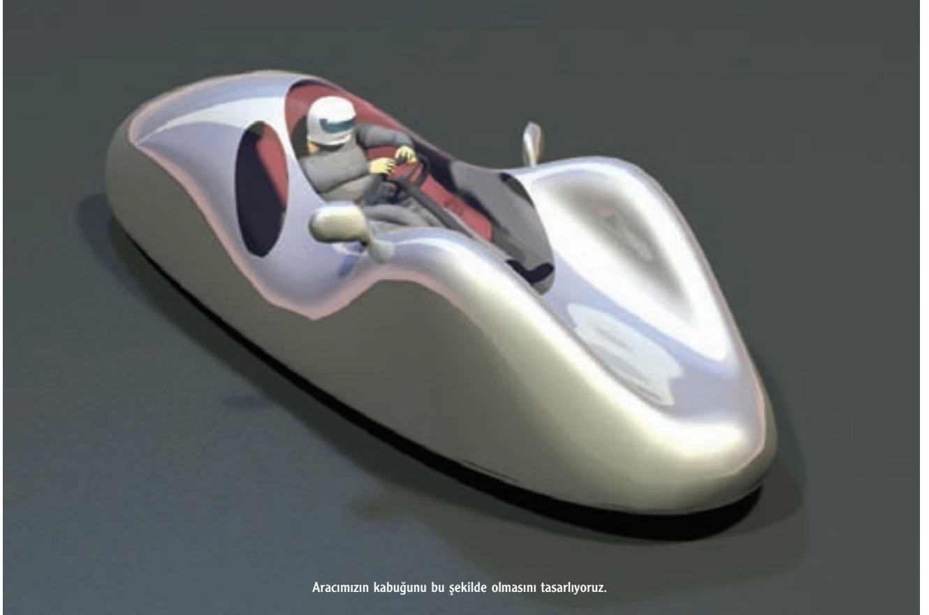
Aracımızın kabuğunu bu şekilde olmasını tasarlıyoruz.