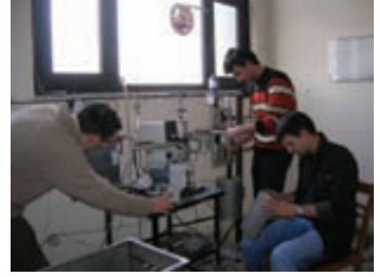
Mekanik ekibimiz çalışırken

yardıma açtık. Yarışa birkaç ay kadar bir süre kala üretim aktivitelerimizi tamamlamayı ve aracımızı test edebilmeyi hedefliyoruz.